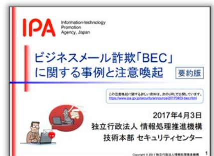
図 注意喚起 要約版

https://www.ipa.go.jp/security/announce/20170403-bec.html