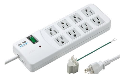
図3 雷サージ対応タップ