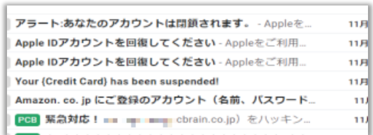
図1 実際に届いたフィッシングメールの例

https://www.jc3.or.jp/topics/virusmail.html