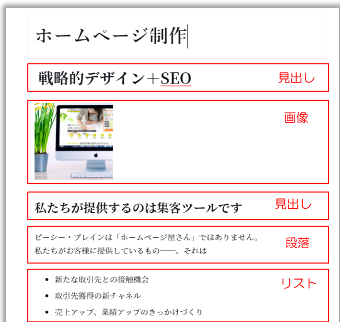
図5 Gutenberg ブロックの利用例

弊社のサポートを利用されている方には、通常のサポートの範囲で対応することもできます。