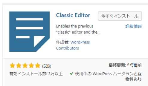
図6 クラシックエディタプラグイン

このような時には、「 Classic Editor （クラシックエディタ）」というプラグインをインストールすることで以前と同じに利用することができます。